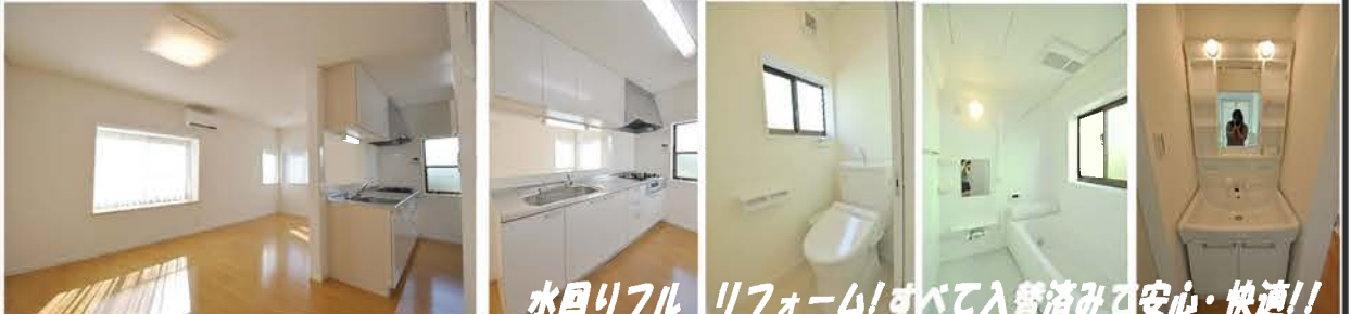
水回りフルリフォーム!すべて入替済みで安心・快適!!

より詳細な情報は、 http://wako-re.info/ 物件写真・詳細図面等多数掲載!