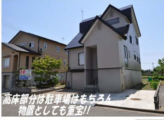
高床部分は駐車場はもちろん物置としても重宝!!

システムキッチン・ユニットバス・トイレ・洗面化粧台交換しました! 雪国には心強い高床・自然落雪式屋根+前面8m融雪道路!