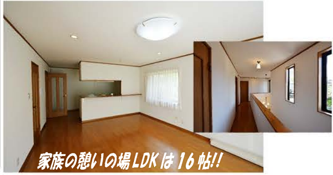
家族の憩いの場LDKは16帖!!