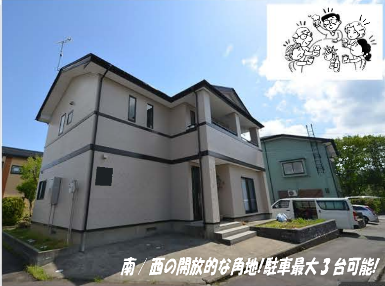
南/西の開放的な角地!駐車最大3台可能!